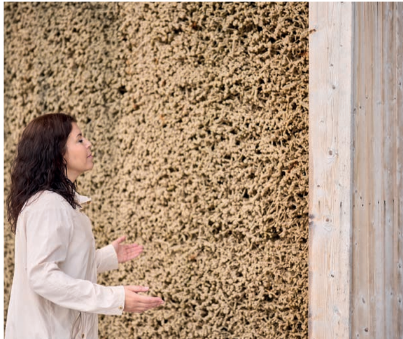
Heilsame Sole in Bad Sulza